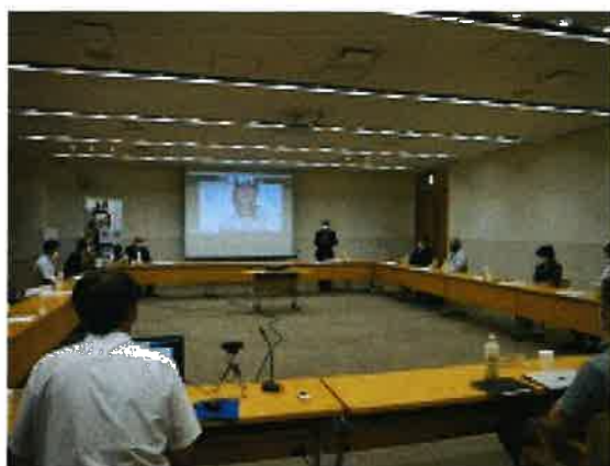
<8月5日> 第1回職親プロジェクト九州 連絡会議の様子